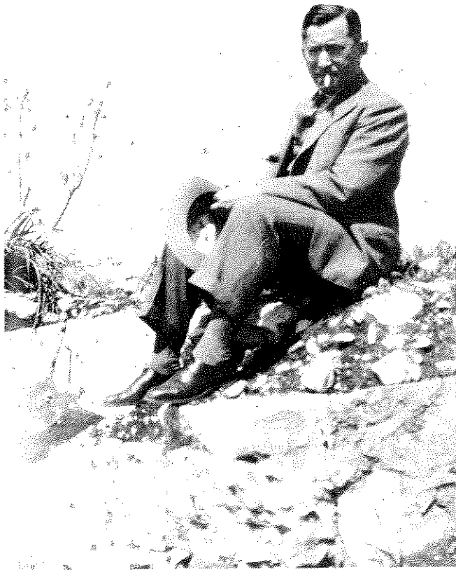
בעת טיול בארץ, בראש העין

הוא שב לארץ ישראל, שהיתה בינתיים למדינת ישראל ושלח ידו בעיסוקים מגוונים. עתה נבחר לחבר הנהלת הסוכנות היהודית, ועמד תחילה בראש המחלקה ליחסי חוץ ולאחר מכן בראש המחלקה הכלכלית. עם זאת מצא תמיד זמן לעסוק בעתונאות וטרח במיוחד לקדם שורה שלמה של כתבי עת ברוסית, שפורסמו בירושלים ונועדו להביא ליהודי ברית המועצות את בשורת ציון והציונות. כן מצא זמן לכתוב טור